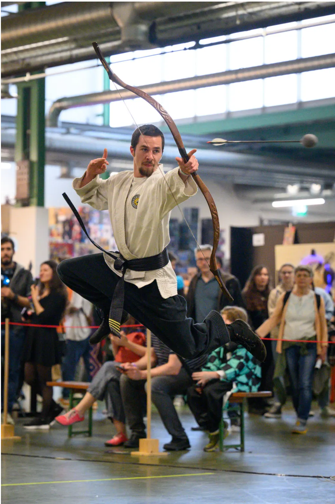
Waffenkunst – wie Pfeil und Bogen sowie Schwerter – begeistert die Fans.