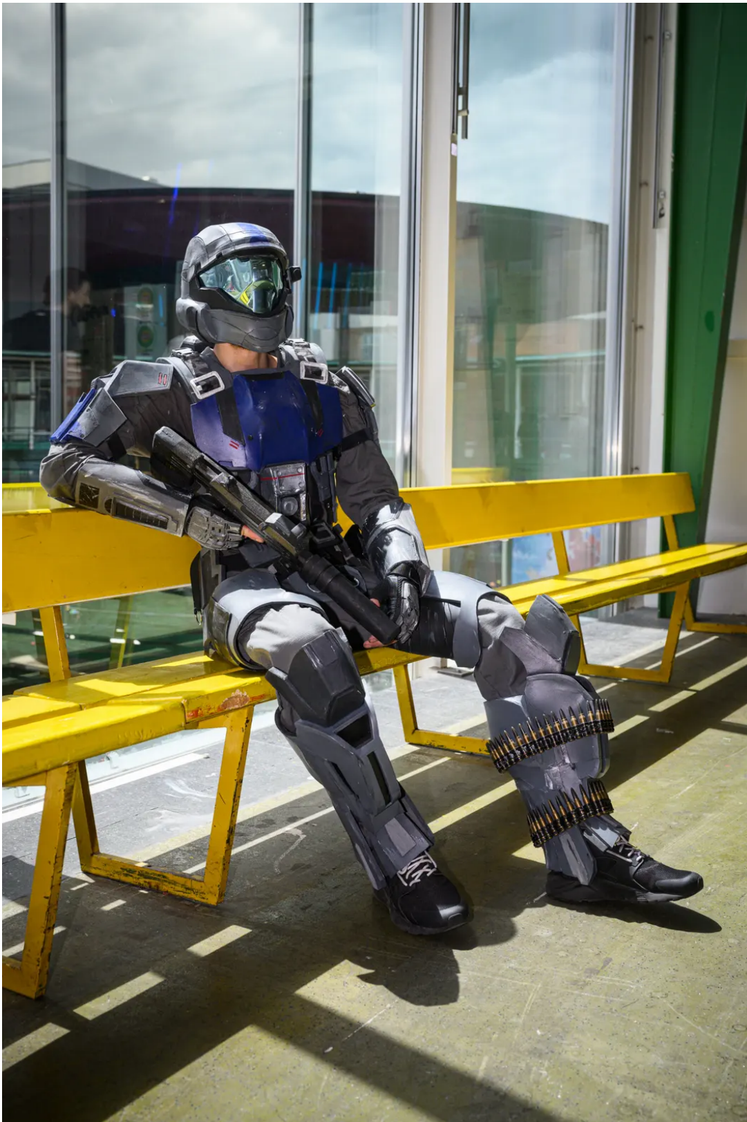
Pause im Trubel: Ein Cosplayer an der Fantasy Basel 2022.

reits kennen. Die andere Welt wird zudem sehr detailgetreu beschrieben. So erfahren wir sehr genau, wie ein Drache aussieht oder die Welt beschaffen ist. Oft haben die Bücher sogar Karten, mit denen die Welten detailliert dargestellt werden.»